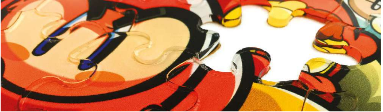
Acrylic / 아크릴