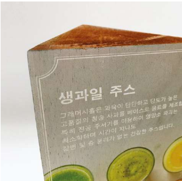
Wood / 나무류