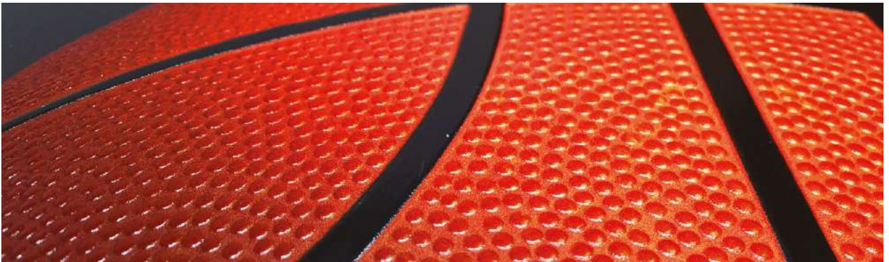
Dibond / 다이본드(Dibond)