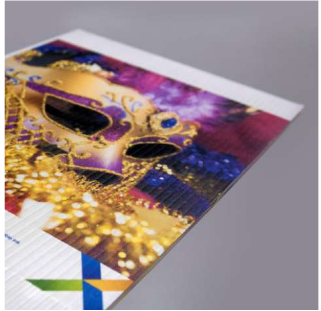
Coroplast / 플라스틱 골판지