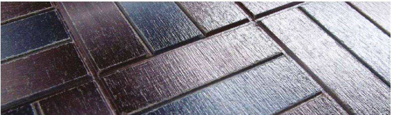
Tiles / 타일