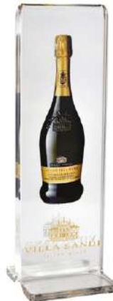
Glass / 유리류

* Adhesion to more unusual materials, such as plastics can be achieved with a Primer after adequate surface treatment.