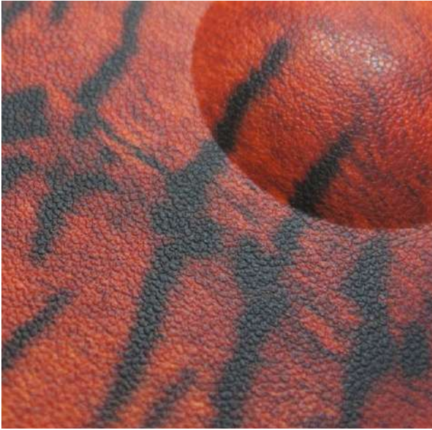
Transformed Plastic / 성형 플라스틱