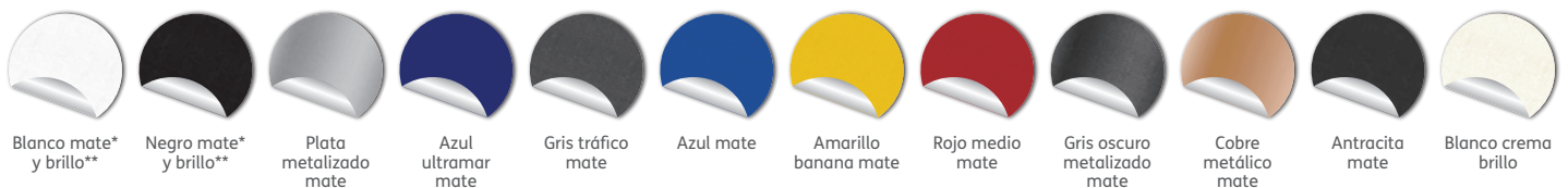
Blanco mate* y brillo**